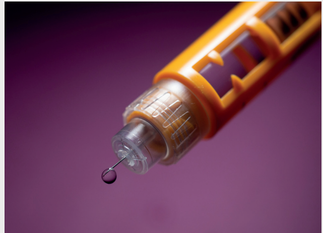
Den moderne insulinpen er et avanceret værktøj med mange indre dele, der kan blive nedslidt med tiden.

Virksomheden endte med optagelser af deres produkt via en ny metode udviklet af DTU. Afsløringen af insulinpennens indre mekanik "live", mens den var i brug, er nyttig viden - både for udvikling og til bedømmelse af hvor mange gange en pen må bruges.