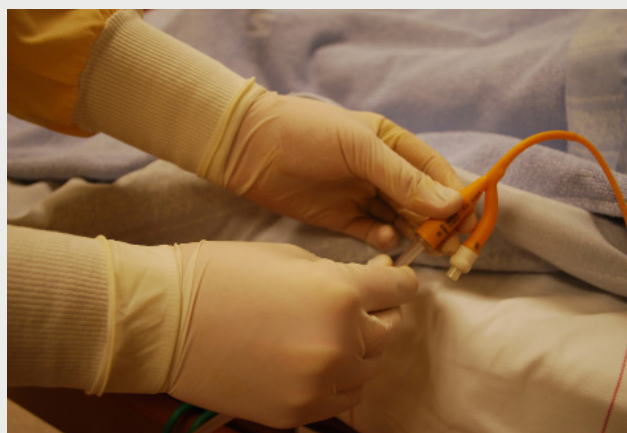
Et kateter kan i fremtiden bruges til at lokalbehandle alvorlige infektioner i kroppen.

Et produkts evne til at lade sig gennemtrænge af væsker kan være usynlig for det blotte øje. Det kan fx være et medicinsk værktøj, der lader opløst antibiotika sive ud inde i kroppen efter behov. Med neutronstråling kan man få det rette indblik i hvordan sådan en effekt finder sted. Undersøgelserne er en slags mikroskopiske målinger på molekyle-niveau, der altså kan påvise et produkts effektivitet over tid. Det er nyttig dokumentation for både virkning og holdbarhed.