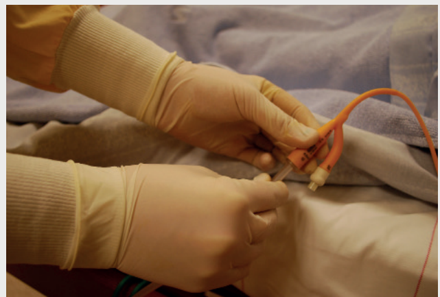
Et kateter kan i fremtiden bruges til at lokalbehandle alvorlige infektioner i blæren.

Neutroner bidrager med svar på de spørgsmål – før udviklingen er løbet så langt i en forkert retning, at den bliver dyr. Teknologien kan kikke på både fysiske produkter og på væsker. Det er endda muligt at optage billeder af objekter i bevægelse - en slags live-streaming. Den viser fx størkningsprocesser, blanding af to materialer på mikro-niveau, eller hvordan plastik nedbrydes.